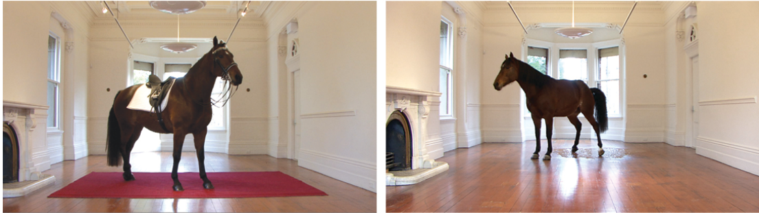
HORSE VIDEO STUDY | 2 Kanal Video | 4 Minute Loop