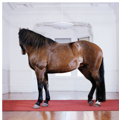
Horse Study (nude) Archival Inkjet Print 80 x 80 cm Auflage: 5 CHF 1200 (ungerahmt)